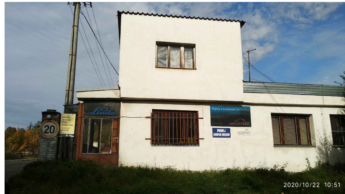
POHLED Z JIHOVÝCHODU