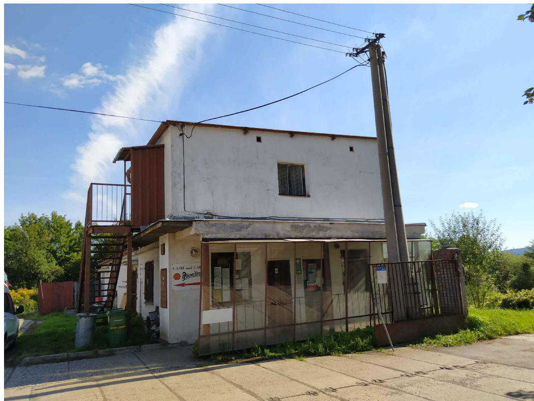
POHLED ZE ZÁPADU