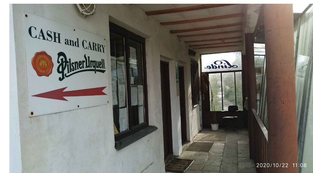
VSTUP DO 1. NP, VERANDA