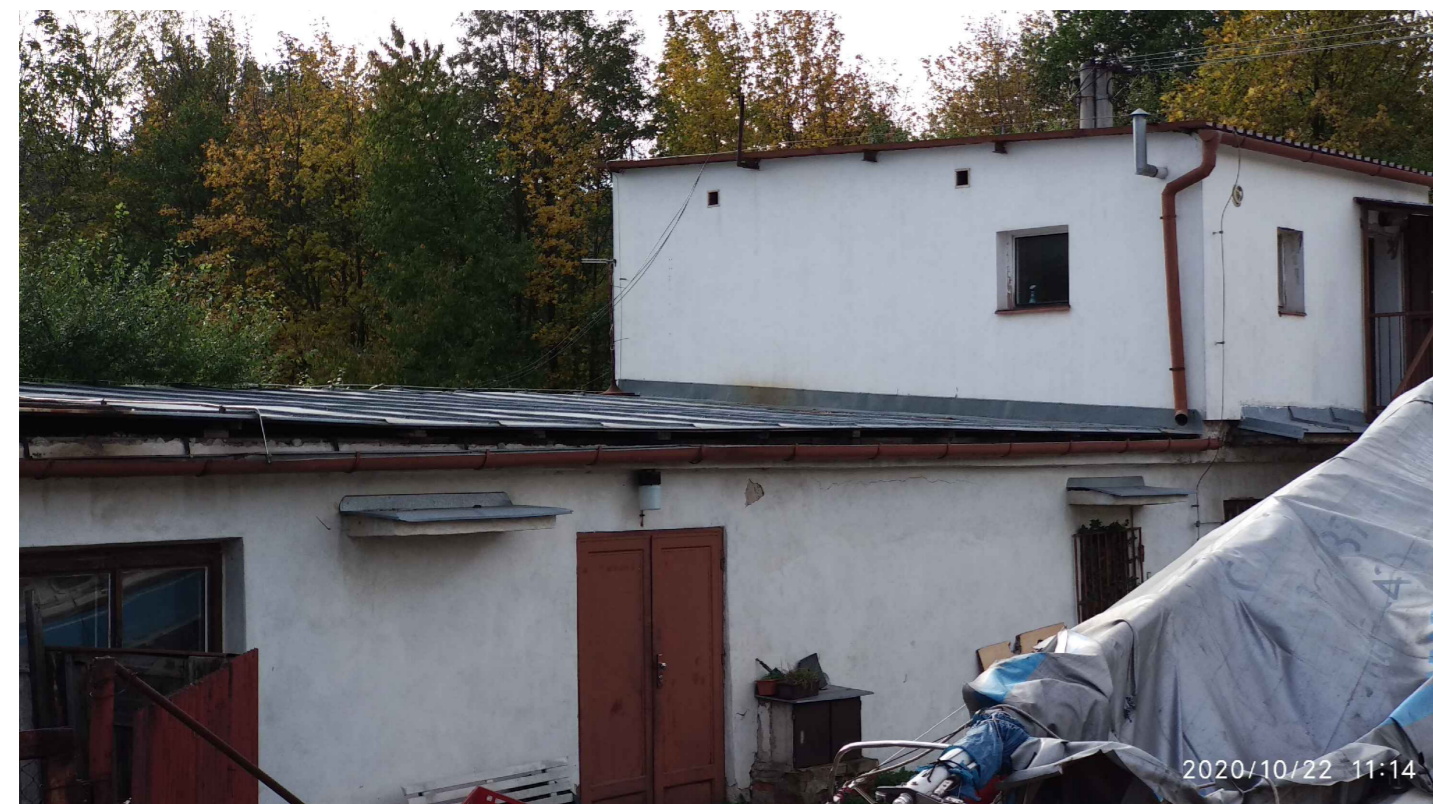
POHLED ZE SEVEROZÁPADU