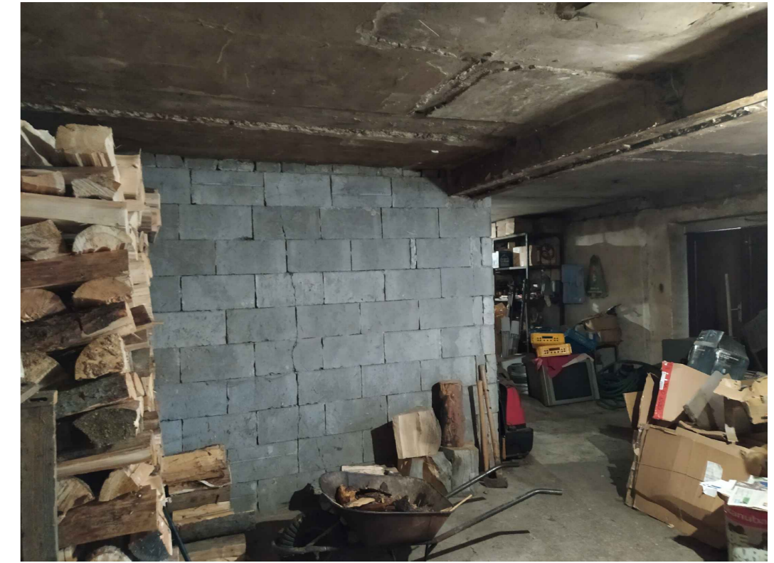
KOTELNA V 1. NP