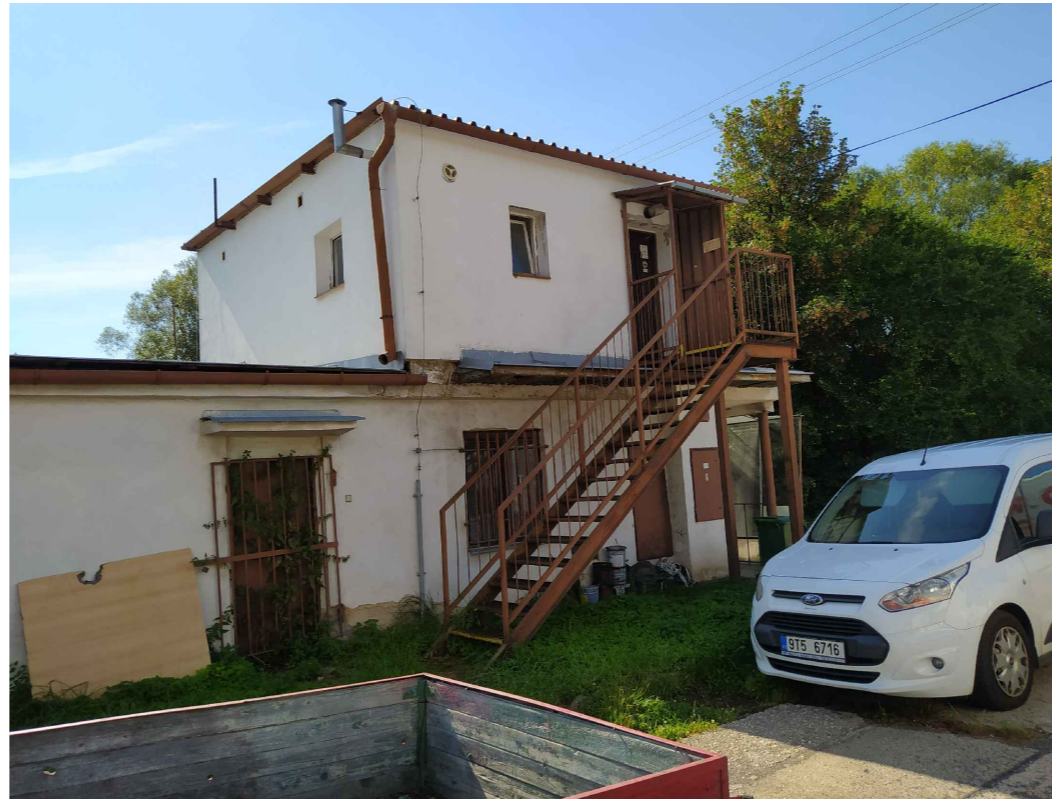
VSTUP DO 2.NP