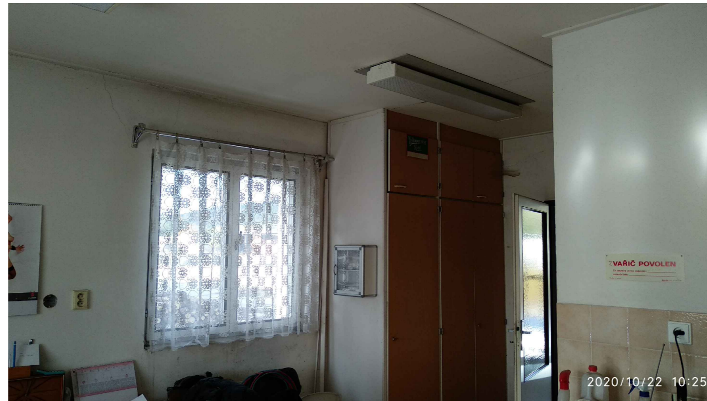
ODPOČÍVÁRNA VE 2. NP